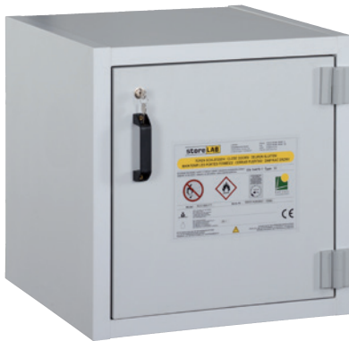
AUS Typ 30 / 600 FT, Tür RAL 7035, Artikel-Nr. B80-2639-A

Abluftventilatoren finden Sie auf Seite 138!