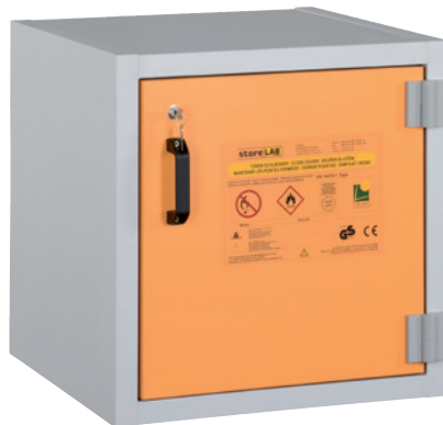
AUS Typ 30 / 600 FT, Tür RAL 1007, Artikel-Nr. B80-2640-A