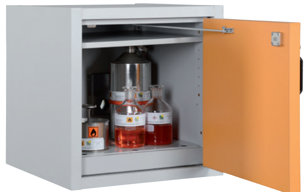
AUS Typ 30 / 600 FT, Tür RAL 1007, Artikel-Nr. B80-2640-A