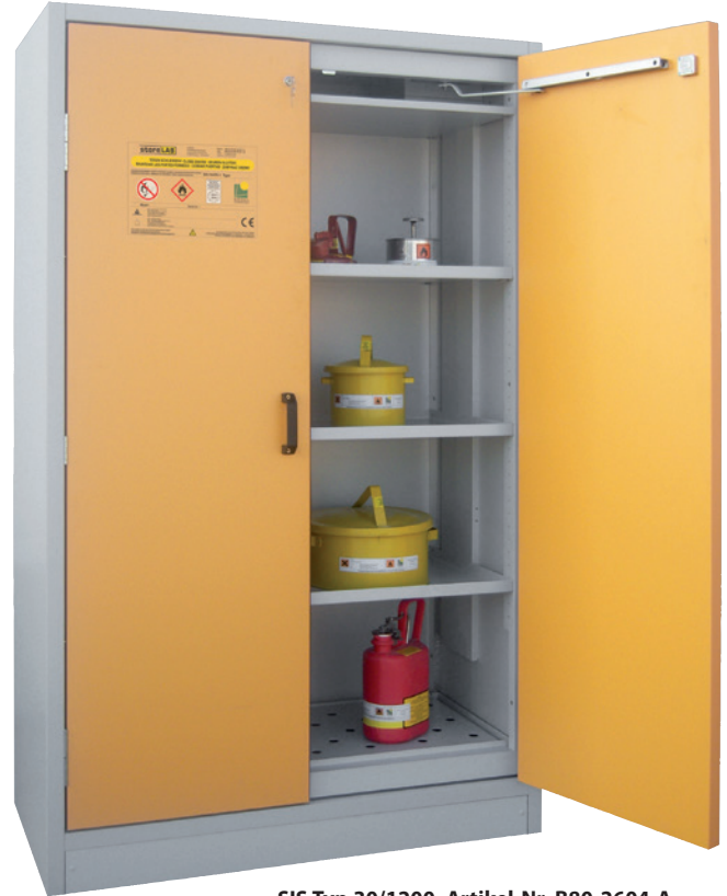
SIS Typ 30/1200, Artikel-Nr. B80-2604-A, Türen RAL 1007 - narzissengelb, inkl. 3 Einlegeböden, Bodenwanne und Lochblechabdeckung