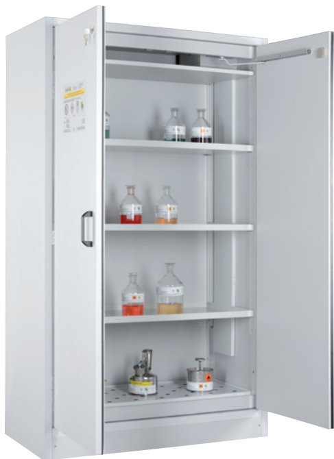
SIS Typ 30/1200, Artikel-Nr. B80-2600-A, Türen RAL 7035 - lichtgrau, inkl. 3 Einlegeböden, Bodenwanne und Lochblechabdeckung