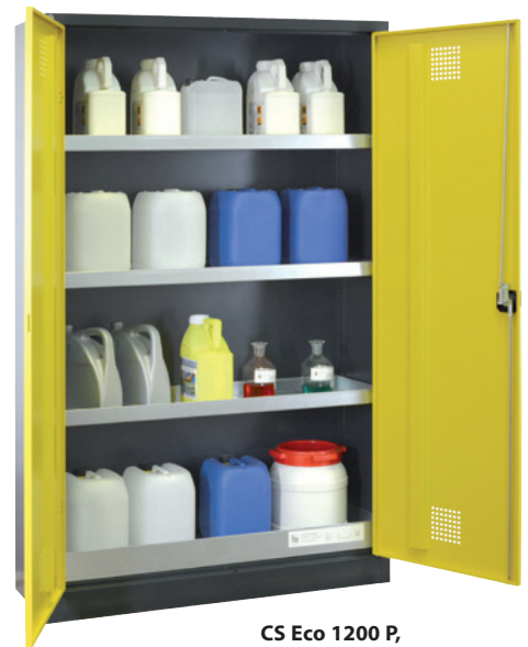
CS Eco 1200 P, Artikel-Nr. B80-6566-A