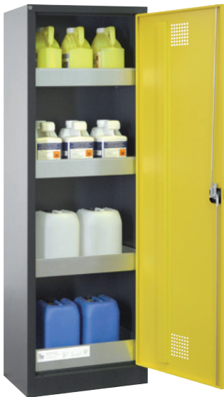
CS Eco 640 P, Artikel-Nr. B80-6564-A