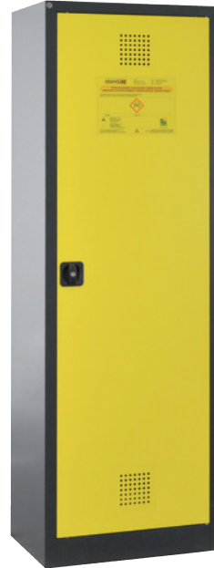
CS Eco 640 P, Artikel-Nr. B80-6564-A