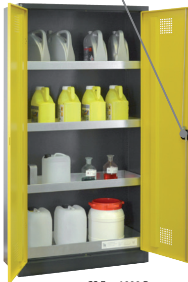
CS Eco 1000 P, Artikel-Nr. B80-6565-A