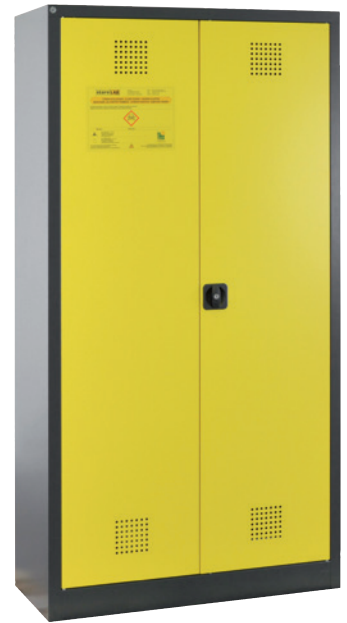
CS Eco 1000 P, Artikel-Nr. B80-6565-A