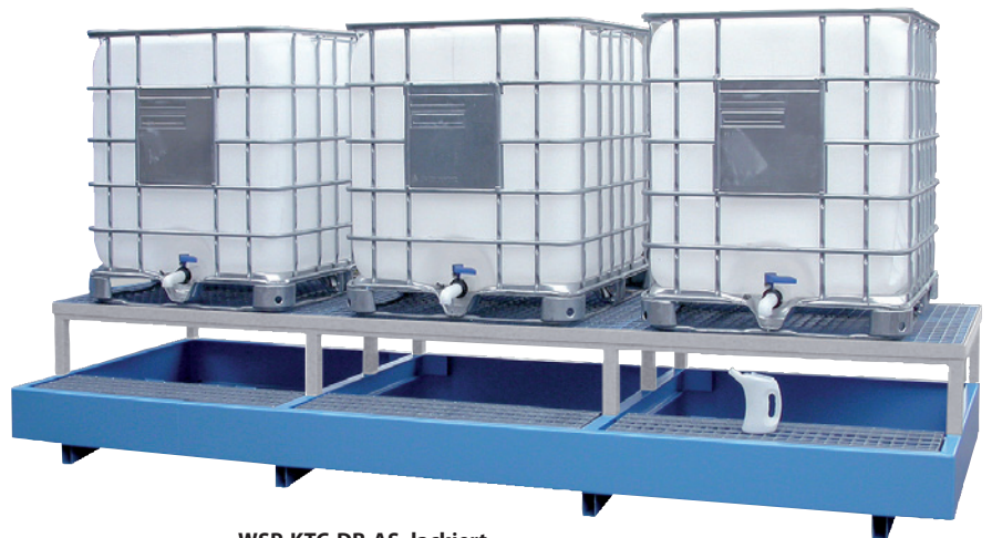
WSP-KTC-DR-AS, lackiert, Artikel-Nr. P21-2608-A