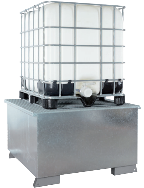
WSP-KTC-OS, feuerverzinkt, Artikel-Nr. P21-1601-B

i Alle Wannen auch mit PE-Einsatz lieferbar!