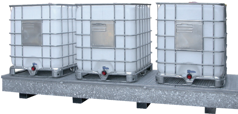
WSP-KTC-DR, feuerverzinkt, Artikel-Nr. P21-1607-A

i Alle Wannen auch mit PE-Einsatz lieferbar!