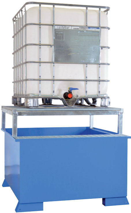
WSP-KTC-AS, lackiert, Artikel-Nr. P21-2603-B