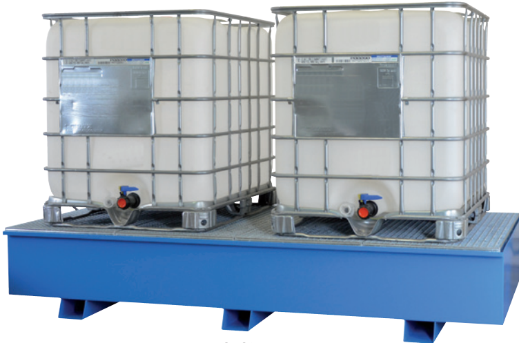
WSP-KTC-ZW, lackiert, Artikel-Nr. P21-2602-B