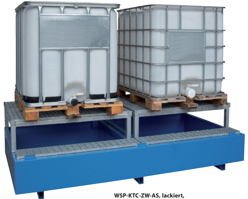
WSP-KTC-ZW-AS, lackiert, Artikel-Nr. P21-2606-A